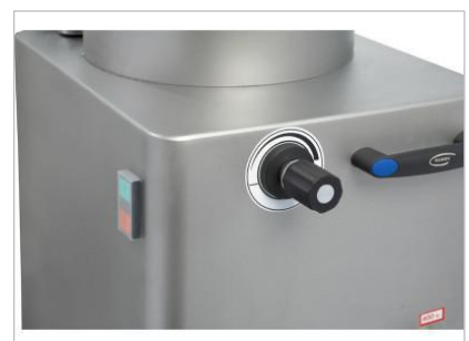
便利で正確な速度設定