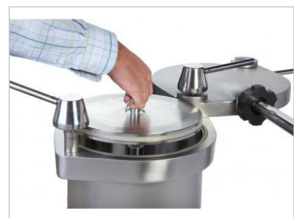
ピストンの取外しも容易